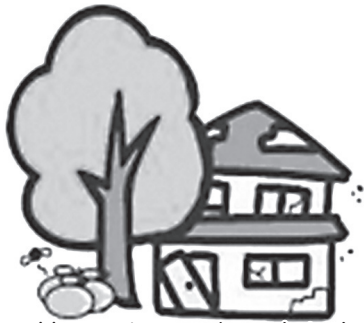
管理されていない空き家（イメージ）

それでも関係者を把握できない場合や、改善されない場合は、住民票などから把握した本籍情報から、関係する自治体に対し、戸籍等の証明書の請求を行い、相続人などの関係者の把握に努めています。