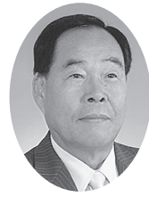
河井 美久 議員