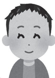
外見の変化による患者の苦痛を軽減するための治療において重視するアピアランスケア（イメージ）