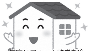
住宅リフォーム助成制度 (イメージ)