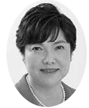
荒木 洋美 議員