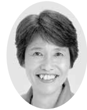
並木 敏恵 議員

2020年9月議会でパートナーシップ制度をはじめ性的マイノリティーへの諸施策の充実を求める請願が採択されました。春日部市もパートナーシップ制度を導入すべきと考えますが、どのような検討がされているのでしょうか。 市長はパートナーシップ制度導入をどう考えていますか。 ○総務部長 パートナーシップ制度は、県内24自治体が導入済、10自治体が導入決定、本市を含めた24自治体が検討中で、検討していないのは5自治体です。各種調査結果では、性的マイノリティーは「差別的な言動をされる」「嫌がらせやいじめを受ける」などが多くあり、性的マイノリティーの人權を守るために必要なこととして「理解を深める教育」という回答が多くなっています。そのため、本年度は市職員が理解を深め、適切に対応でき