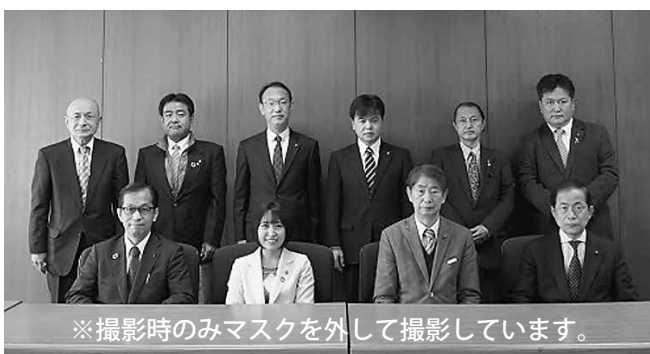
※撮影時のみマスクを外して撮影しています。