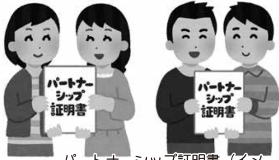
パートナーシップ証明書 (イメージ)