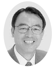
松本 浩一 議員

この問題が明らかとなったのは昨年11月です。生活支援課で平成23年度から残業手当を予算内に抑える調整を行っており、電磁的記録や紙媒体による二重帳簿があることが判明しました。職員組合は1月25日に5項目の要求書を提出しましたが、市は調査中を理由にいまだに支払い方針、スケジュールを示していません。そこで、いつになったら調査を終え、未払い分が支給されるのか伺います。