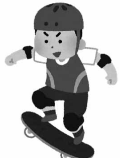
スケートボードをする青少年（イメージ）