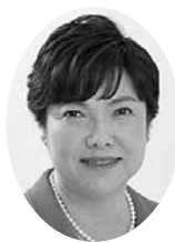
荒木 洋美 議員

高齢者の一人暮らしで自動車免許を返納された方から「日常の買い物に困難になってきました。バス停まで遠く、買い物を頼める身内がいまません。介護保険もまだ利用できません。どうしたらよいでしょうか」と相談されました。この問題は遠からず起こり得