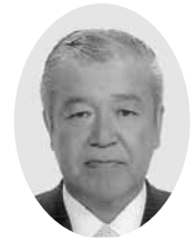
山崎 進 議員

子供たちのいじめ問題や自殺、あるいは成人になってからの凶悪犯罪がたびたび発生しています。こうした事件は日本の高度成長期以降、社会環境の変化等でストレスがたまっていくことが一つの要因ではないかと思えます。市内には多くの公園がありますが、いろいろな規制があつて自由に遊ぶことはできません。そこで、ボール遊びやスケートボードなどストレス発散に気軽に遊べる施設が必要と思えますが、どんなものがあるか、また、その効果について伺います。併せて、一例としてスケートパークを設置する場合の課題について伺います。