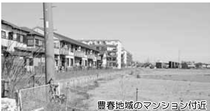
豊春地域のマンション付近