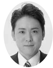
栄 寛美 議員

平成27年度は、旧春日部市と旧庄和町が合併し10周年の節目を迎えます。今後は、新たに市全体の大きな課題に取り組む必要があります。