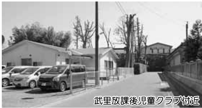
武里放課後児童クラブ付近