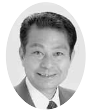
卯月 武彦 議員

子どもの貧困率が上昇し、2012年に16・3パーセントとなりました。昨年実施された「子どもの貧困対策の推進に関する法律」では、地方公共団体が、教育の支援、生活の支援、経済的支援、貧困に関する調査や研究などの対策を講ずるものと定められています。本市では法に基づいて実態調査を行う考えはあるのでしょうか。