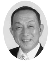
斉藤 義則 議員

庄和北部地域には、市民の生活文化の振興に深く寄与し、地域の市民活動における拠点的な施設である公民館・コミュニティ施設がありません。また、庄和北部地域では学校再編の協議がなされ、江戸川中学校に小中一貫校の開校を目指す旨の具申書が教育委員会に提出されました。