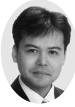
木村 圭一 議員

若い世代に自治会に加入していただくためには、ホームページを開設し、自治会独自の魅力を訴えていくことも一つの手段であると考えます。