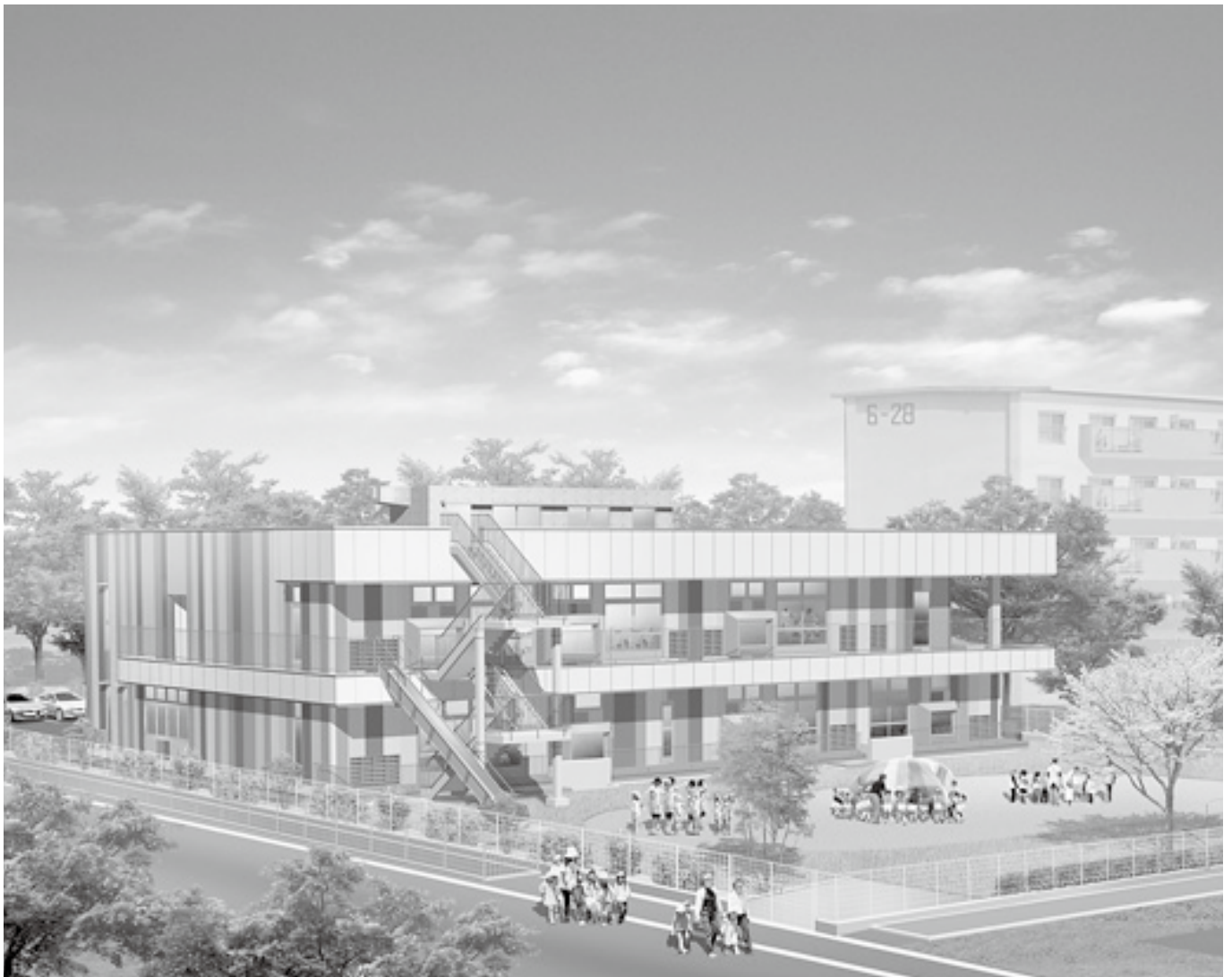
武里南保育所（完成イメージ）