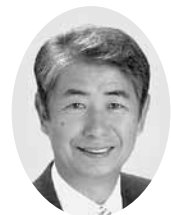
坂巻 勝則 議員

豊春地域にあるマンション付近とその周辺は、少し強い雨が降り続くと、道路や駐車場が冠水し、市民生活に多大な困難をもたらしています。