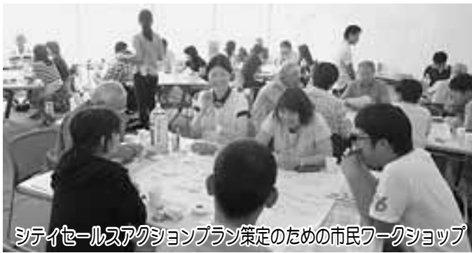
シテイセールスアクションプラン策定のための市民ワークショップ

シテイセールスアクションプランの中で、子育てや音楽など本市が誇る8つの魅力を示しましたが、本市の持つ有力なポテンシャルとすることができると思います。今後、これらの魅力を育てる取り組みを行ってまいります。