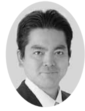
鬼丸 裕史 議員

「子ども・子育て支援新制度」が平成27年4月に本格施行されます。子育てしやすい環境を整えることが急務であると思います。「子育てするなら春日部で」との意気込みで、利用しやすい保育所、待機児童の解消、0歳児からの低年齢児保育の拡充、病児・病後児保育の確立等を早期に取り組んでもらいたく、以下の点を質問します。