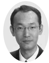
鈴木 一利 議員

本市では、地域防犯活動の一環として青色回転灯防犯パトロール車（青パト）を巡回させ防犯強化に努めています。そこで、青パトのパトロール充実へ提案します。近年、車に取り付けるドライブレコーダーという録画機器がありま