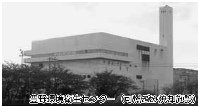
豊野環境衛生センター (可燃ごみ焼却施設)