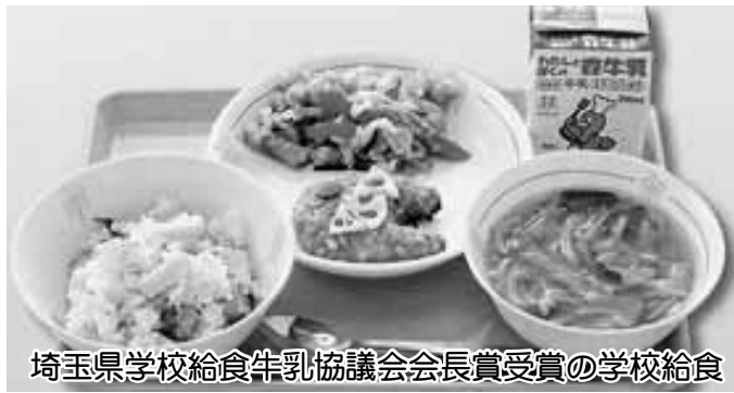
埼玉県学校給食牛乳協議会会長賞受賞の学校給食

このほか ○国道4号バイパス、広域農道交差点の農道に右折帯を ○高齢者福祉避難所設置の早期拡充を