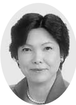
荒木 洋美 議員

市民の健康増進と国民健康保険の健全運営に向けた医療費の適正化が、喫緊の課題となっています。そこで、国民健康保険の医療費抑制の面から3点提案します。