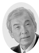
井上 英治 議員

春日部駅付近連続立体交差事業が一向に事業着手できないために、歩行者の東西往来が阻害されています。そのため、駅構内の無料通り抜けや駅橋上化の提案がなされてきましたが、困難です。そこで、三須医院と秋葉神社間にある富士見町地下道の北千住側階段にベビーカーでも楽々と押していけるスロープの設置を提案します。スロープを設置した場合、現在の階段の角度30度を何度にして、スロープ長は西側何メートル、東側は何メートルになるでしょうか。また、工事の際の課題や市内に角度の参考になるスロープはありますか。