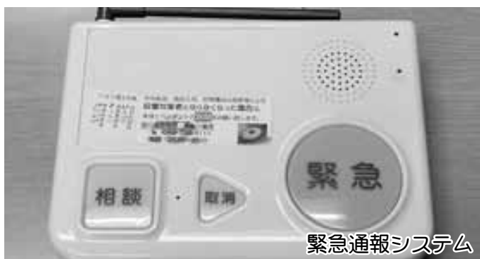
緊急通報システム

このほか ○避難場所誘導案内つきの電柱広告について ○不妊治療に対する補助について