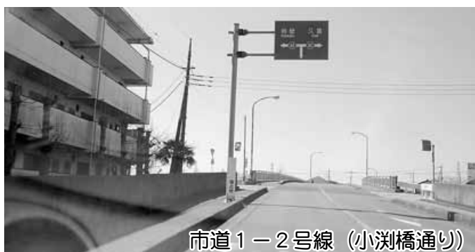
市道1-2号線（小淵橋通り）