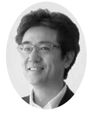
古沢 耕作 議員

あの、1万5千人以上もの尊い命が奪われた、原発事故を伴う東日本大震災から、4年を迎えました。しかし、復興は思うように進んでおらず、いまだ避難生活を送る方々が、全国に約23万人、仮設住宅で暮らす方も約16万人余りいらっしゃいます。