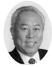
中川 朗 議員

平成27年度は「地方創生元年」と言われています。地方創生担当大臣が誕生し、「まち・ひと・しごと」の創生に向けた取り組みが地方を巻き込みながら一気に加速してきています。