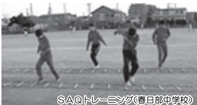
SAQトレーニング(春日部中学校)

○BIMMSの導入について ○家庭用ごみの対策について ○公園など既存施設の活用によるまちづくりについて