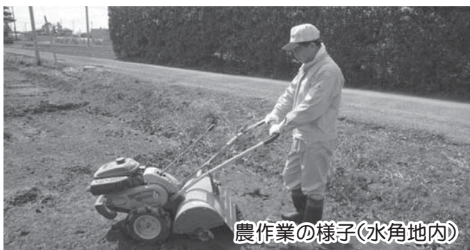
農作業の様子(水角地内)

○発達障害者や文字を認識することが困難な児童生徒のために、デージー教科書の活用を