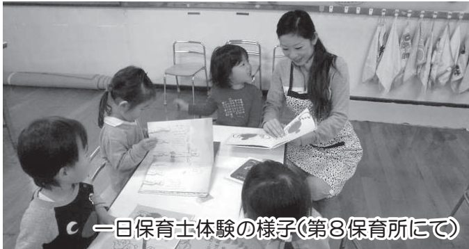
一日保育士体験の様子(第8保育所にて)

し方を見て、子育てのヒントを発見してもらう。また、保育所での子どもたちの様子を見て、家庭とは違う集団生活の中での子どもの多様性や成長過程を理解してもらう。言葉で伝わりにくい保育の考え方や取り組みを見て、肌で感じ取ってもらいなど、絶好の機会と捉えています。この機会を通じて、親と子どもの間で、さらには親と保育士の間で、密接で信頼に裏打ちされた関係が構築できるよう取り組みたいと考えています。