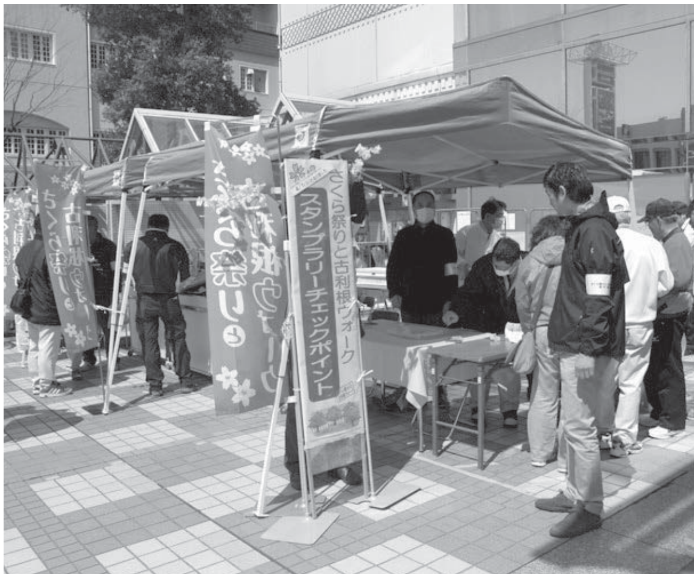
さくら祭りと古利根ウォーク（スタンプラリーチェックポイント）