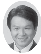
一弘 岩谷 一 議員