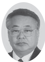
武 幹員 議員

市長の平成24年度施政方針に犯罪防止のまちづくりの推進とありますが、振り込め詐欺対策について伺います。