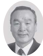
蛭間 靖造員 議員

入後のメリットは適切な管理のほか、指定管理者の自主事業として、さまざまなイベントが行われています。未買収地の面積は市道等を含め、約3万6800平方メートルあり、借地をしている土地は用地買収等を図り、未整備地についても用地の確保に努めていきたいと考えています。遊具の点検は指定管理者が年1回行い、増設は耐用年数が過ぎたものや修繕では直し切れないものに対し、取り替え等の対策を考えています。