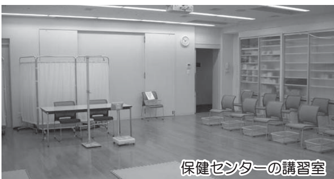
保健センターの講習室