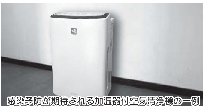
感染予防が期待される加湿器付空気清浄機の一例