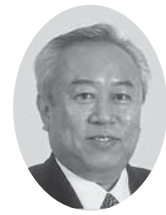
中川 朗 議員

県では、東日本大震災で明らかになった帰宅困難者対策や放射能汚染対策、女性に配慮した避難所の管理運営等の課題について、対策を地域防災計画に盛り込み、自助、共助、公助の連携と、役割を再認識し、県全体の防災力の向上を図るため、県の地域防災計画を平成23年11月に改定しました。本市でも、今回の震災の教訓を生かし市の地域防災計画を見直しますが、震災の発生時から、これまでの対応について、何を教訓として考えているのか伺います。