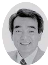
秋山 和員 議員