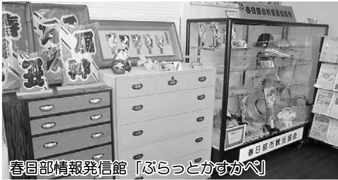
春日部情報発信館「ぷらっとかすかべ」