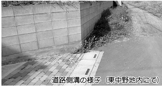
道路側溝の様子（東中野地内にて）