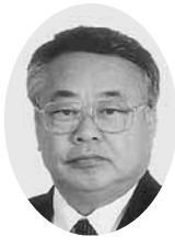
武 幹也 議員