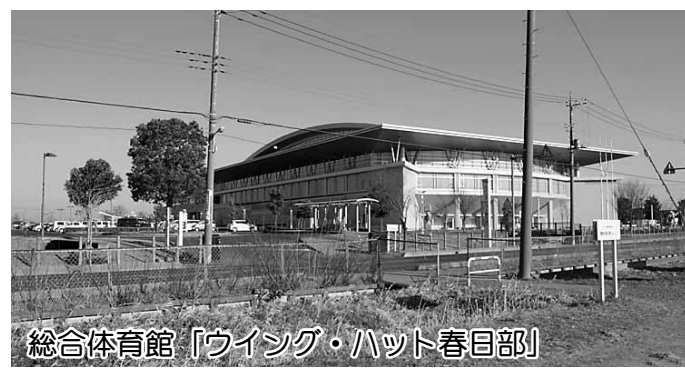
総合体育館「ウイング・ハット春日部」

16名になります。③平成23年度決算で、借地料が約920万4000円、維持管理費が約1036万2000円です。④暫定施設への市民の皆さまからの要望は、フェンスの高層化や防風ネットの設置、日よけテントの増設などです。⑤今後の用地取得は、買い取りを希望される地権者の方を優先しつつ、計画的に進めていきます。