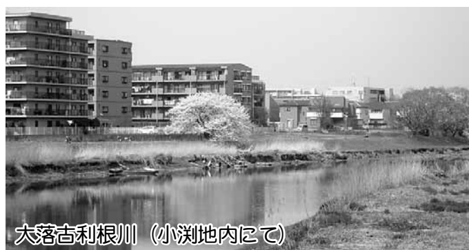
大落古利根川（小洲地内にて）