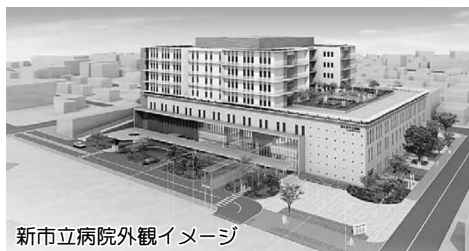
新市立病院外観イメージ