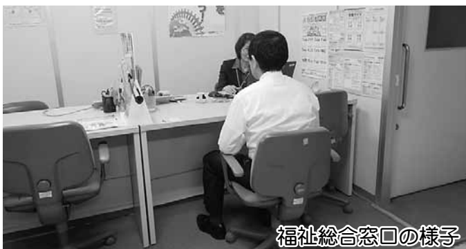
福祉総合窓口の様子