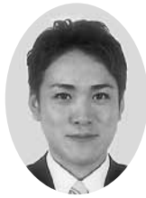
美寛 栄 議員

現在本市には、3つの地域に核となる児童センターが設置されています。これら児童館の果たす役割は大きく、児童館は、児童に健全な遊び場を与え、児童の健康を増進し、情操を豊かにすることを目的としています。子どもたちに健全な遊びを通して、自主