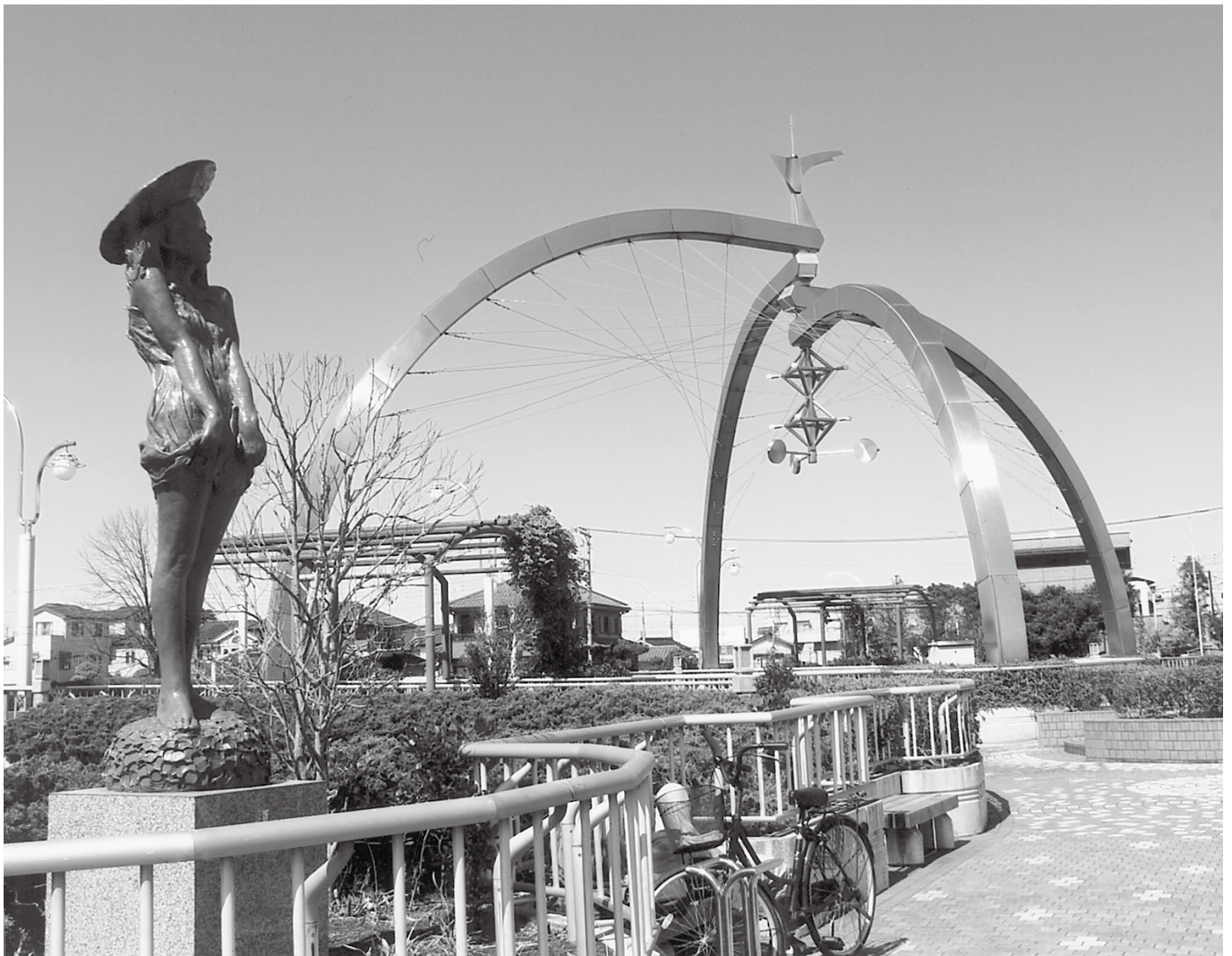
公募作品「私の好きな春日部市（古利根公園橋にて）」