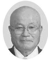
小島 文男 議員