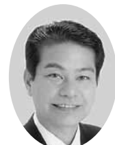
卯月 武彦 議員

政府は、25年度予算案に生活扶助基準の引き下げを盛り込みました。3年間で670億円、平均6・5パーセント、最大10パーセントの削減です。基準が引き下げられると、生活保護費が削減されるだけでなく、生活保護から外れ、国民健康保険税などが課され、生活が大幅に悪化する世帯も生じる恐れがあります。そのため、生活保護から外れないような対策ができないか伺います。また、生活保護だけでなく、保育所の保育料や就学援助制度などにも影響が出ないようにすべきと思いますがいかがでしょうか。