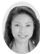
渡辺 浩美 議員

高齢の方から、収入が年金だけになったとき、家賃や食費などを支払うのが精一杯となり、病気になる際に医療費が心配で、具合が悪くても病院へ行けないという話を聞きます。