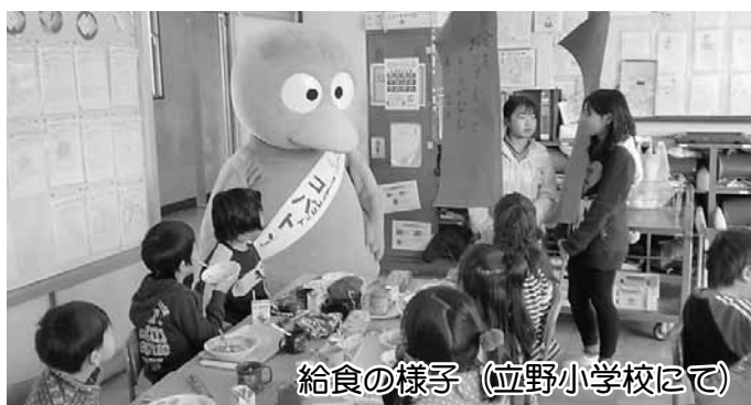
給食の様子 (立野小学校にて)